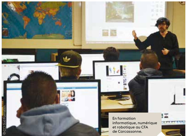
En formation informatique, numérique et robotique au CFA de Carcassonne.

L a crise économique née de la pandémie de Covid-19 intervient à un moment-clé pour le secteur de l'apprentissage. En modifiant en profondeur sa gouvernance et ses règles, la loi "Avenir professionnel" a posé les jalons de nouveaux modèles économiques et poussé les enjeux de modernisation des organisations et des pratiques. La libéralisation du marché, le financement au contrat et la reprise en main par les branches du sujet de l'apprentissage étaient en cours de mise en place au sein d'un écosystème revisité. En 2019, les premiers effets de cette transformation se faisaient déjà sentir. L'épidémie de coronavirus est venue précipiter ces mouvements de fond. Au premier rang desquels la transformation digitale.