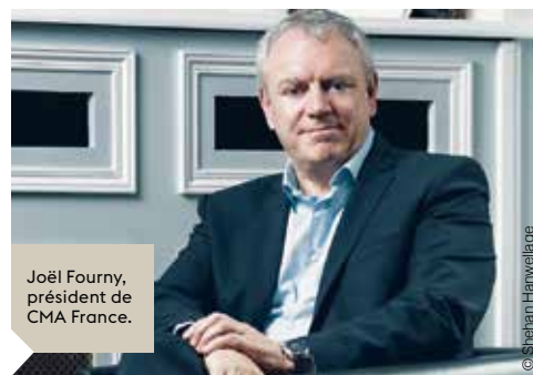
Joël Fourny, président de CMA France.

Les signaux encourageants observés en ce début de mois de septembre tiennent sans doute à ces mesures exceptionnelles et aux perspectives qu'ouvre le plan de relance de 100 milliards d'euros du gouvernement. Restent malgré tout des