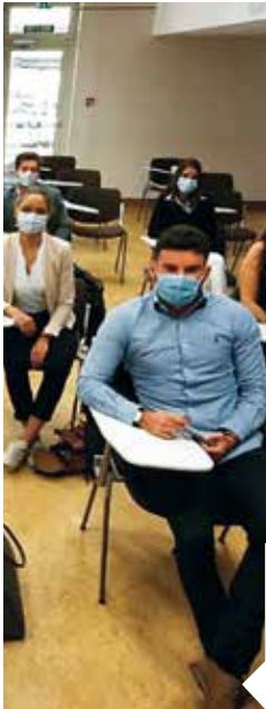
Le 1 er septembre 2020, la rentrée pour vingt alternants, sur le site de Saint-Ouen du groupe Bosch.