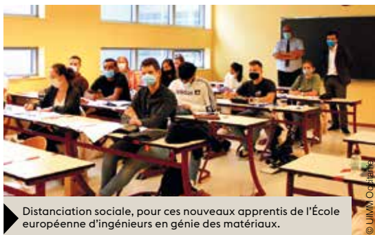
Distanciation sociale, pour ces nouveaux apprentis de l'École européenne d'ingénieurs en génie des matériaux.