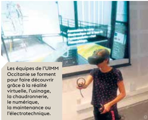
Les équipes de l'UIMM Occitanie se forment pour faire découvrir grâce à la réalité virtuelle, l'usinage, la chaudronnerie, le numérique, la maintenance ou l'électrotechnique.

Propos recueillis par Estelle Durand et Catherine Trocquemé